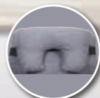
Appareil de soutien partiel de la tête