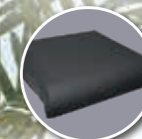
Coussin Classe II