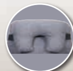
Appareil de soutien partiel de la tête