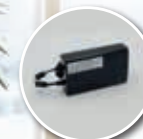
Kit batterie Evasion e