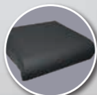
Coussin Classe II