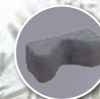
Cale tête fabrication spéciale