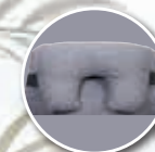
Appareil de soutien partiel de la tête