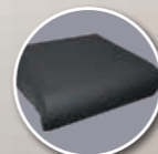
Coussin Classe II