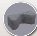
Cale tête fabrication spéciale