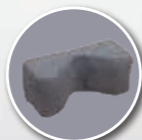
Cale tête fabrication spéciale