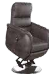
Modèle présenté en Safari Charbon

Existe aussi en version pivotante releveur 1 moteur: Le confort Carat Pivo, pour une rotation à 360°