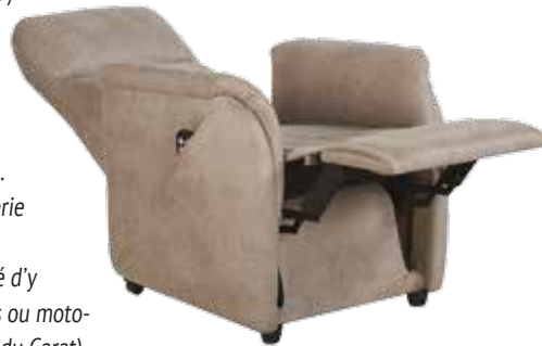
Modèle présenté en Safari Crème

Créer un ensemble complet salon avec la possibilité d'y associer un canapé 2 ou 3 places (fixes, mécaniques ou motorisés; explications page 35 et la version pivotante du Carat).